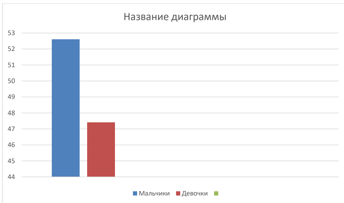
Гендерное распределение детей

В средней группе №10 (возраст от 4 до 5 лет) - 38 детей, из них – 18 девочек, 20 мальчиков.